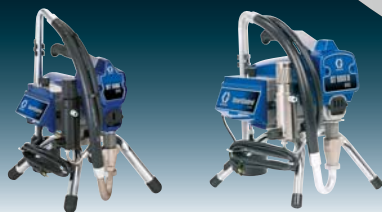
ST Max 395