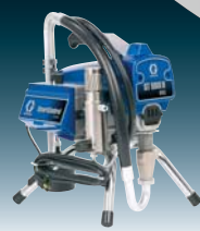
ST Max II 495