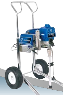
ST Max II 595 Hi-Boy