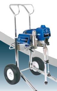
ST Max II 495 Hi-Boy