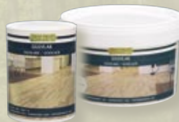
Gulvlak, vandbaseret 3/4 l., 2,5 l. og 5 l. Vandbaseret lak i mat, silkemat og blank.