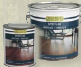
Spritlak, spritbaseret 3/4 l. og 2,5 l. Spritbaseret lak i mat og silkeamat.