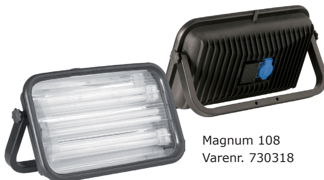
Magnum 108 Varenr. 730318

Kontakt din salgskonsulent eller dit lokale kundecenter, hvis du vil høre mere og vores lamper.