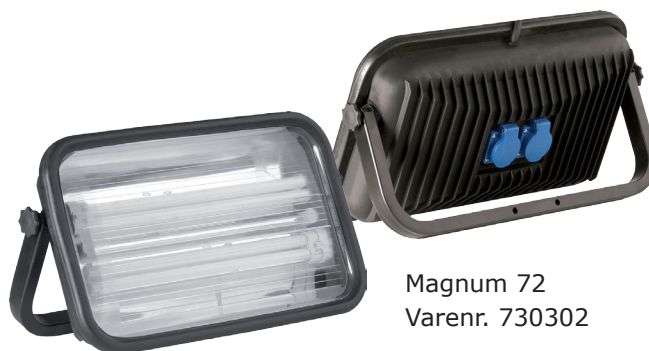
Magnum 72 Varenr. 730302