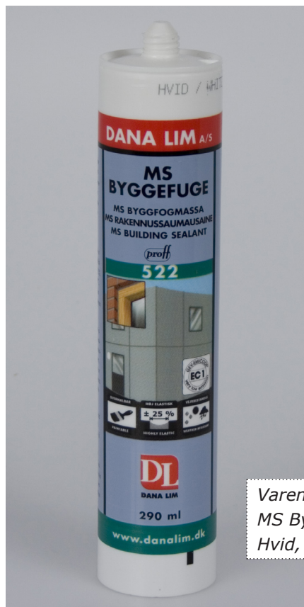
Varenr. 220016 MS Byggefuge 522 Hvid, 290 ml

MS Byggefuge 522 er et af de mest emissionslave fugeprodukter (godkendt i henhold til Emicode EC 1), og er derfor klart at foretrække til indendørs opgaver. Fugemassen er desuden godkendt til indirekte kontakt med fødevarer.